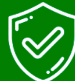
Entes de regulación