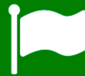
Gobierno Entorno Político